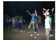
キャンプファイヤー♪